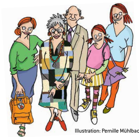
Illustration: Pernille Mühlbach